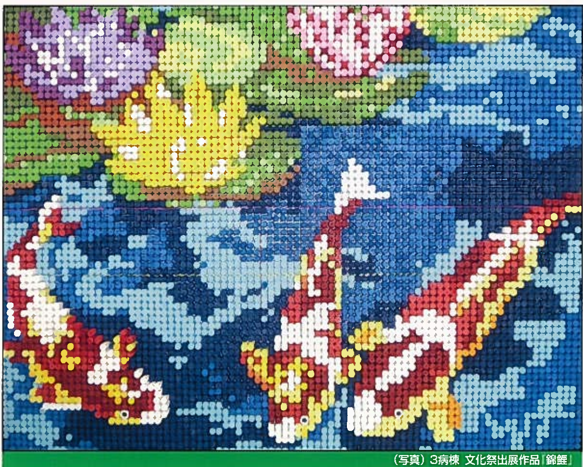
(写真) 3病棟 文化祭出展作品 錦鯉